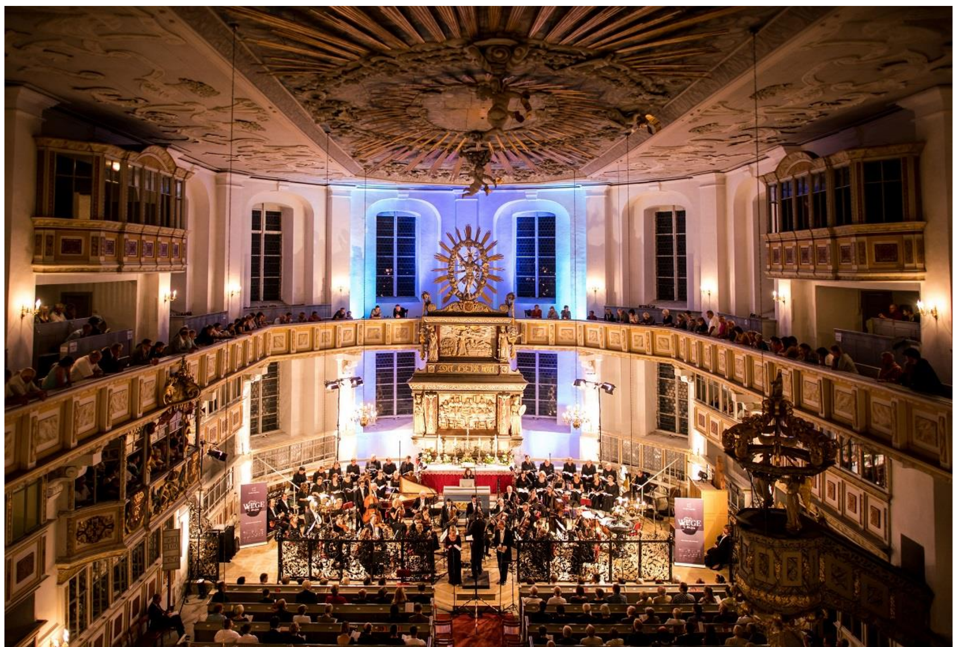
St. Georgenkirche Schwarzenberg